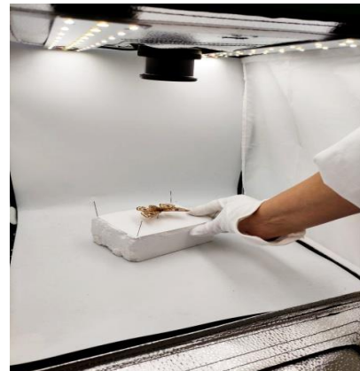
Рис. 2. Приклад оцифрування метелика на базі Canon EOS 800D.

Для відображення ентомологічних зразків та етикеток зображення зберігаються у jpeg форматі. Використовуючи Microsoft Picture Manager 2007 проводили обрізку фотографій відповідно до меж об'єкту, корекцію їх повороту, кольору та яскравості. Крім того, за допомогою Paint проводили очищення фону від забруднень, ворсинок та лусочок. Оброблені файли цифрових зображень необхідно зберігати на кількох фізичних носіях (картах флеш пам'яті) у трьох різних папках, в залежності від цілі подальшого застосування: оригінал, редаговані та 1500 тпр розміром для завантаження до бази даних веб ресурсу. У подальшому інформація про оцифровані зразки вноситься, зокрема до бази даних веб ресурсу Державного природознавчого музею НАН України – Центру даних «Біорізноманіття України» ( http://dc.snmh.org/ ).