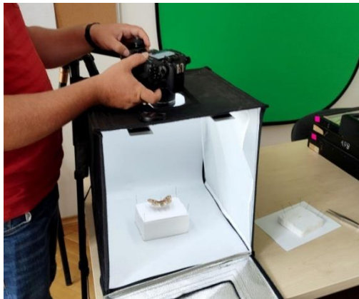
Рис. 1. Фотосистема на базі Canon EOS 800D, що використовується для оцифрування ентомологічних зразків.

Оцифрування зразків здійснювали фотоапаратом Canon EOS 650D з об'єктивом Canon EF 100mm f/2.8L Macro IS USM. Крім того, застосовували штативи Cadiso Q999H Professional та штатив Professional Live Stream, освітлювачі: кільцевий зі штативом із зовнішнім діаметром LED освітлювача 16 см, загальною напругою 5W, колірною температурою світла 5500K, загальною освітленістю 3600LM CRI та лайткуб (лайтбокс, фотобокс) для предметної зйомки Puluz PU5040 40×40×40 см (PU5040EU) (рис. 1, 2).