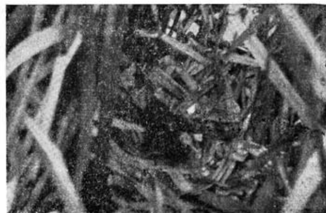
Рис. 2. Надводне гніздо водяного щура.

Виняток із загальної картини заселення річок водяними щурами становлять лівобережні притоки: р. Верещиця і р. Вільховець. Вся низина вздовж берегів цих річок вкрита буйною вологолюбною