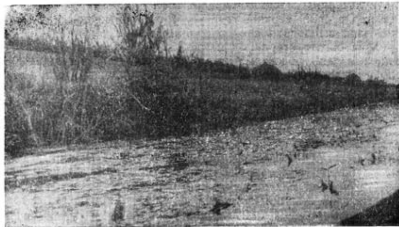
Рис. 1. Річка Верещиця — типове місцезнаходження водяного щура.

Крім стариків, нами були обслідувані стави коропових рибних господарств в ряді сіл — Березець, Підзвіринець, Рудники, Стрільків, Отиневичі, Хом'яківка, Трибухівці, Пишківці, а також річки Тлумачик, Золота Липа і Верещиця (рис. 1). Детально також був обслідуваний Трибухівський став, навколо якого розміщені колгоспні та індивідуальні городи, посіви ярих зернових культур;