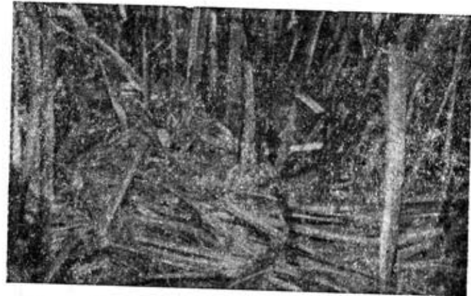
Рис. 3. Кормовий столик водяного щура в мілководній частині ставу.

топлених стеблах ро́гозу. Складається кормовий столик, як правило, з рослин, які його оточують. Домінуючими видами є лепешняк водяний, айр тростинний, хвощ лісовий. Форма кормових столиків різна (табл. 4), але найчастіше овальна з підступами у вигляді стежок. Іноді це — просто довгі стежки з повалених рослин (лепешняка, оситнягу, очерету тощо). Розміри кормових столиків коливаються: довжина від 15 до 80 см і ширина від 12 до 40 см. Часто зустрічаються невеличкі тимчасові столики.